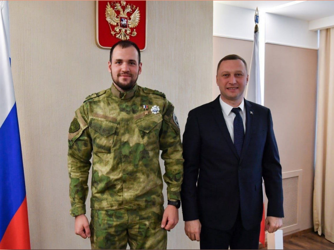
Герой Российской Федерации Никита Палазник, Губернатор Саратовской области Р.В. Бусаргин. Вручение почетного знака Губернатора Саратовской области «За мужество и отвагу». Саратов.