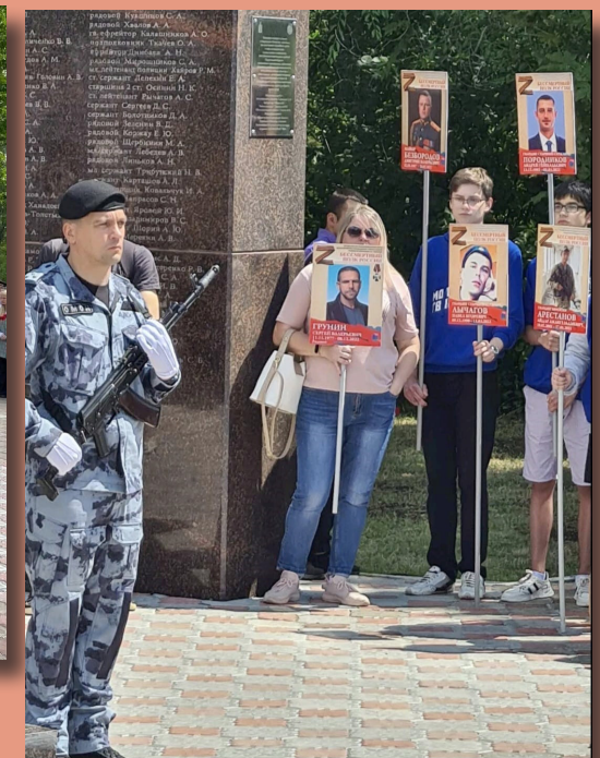
В Парке Победы на Соколовой горе. 6 мая 2023 г., Саратов.