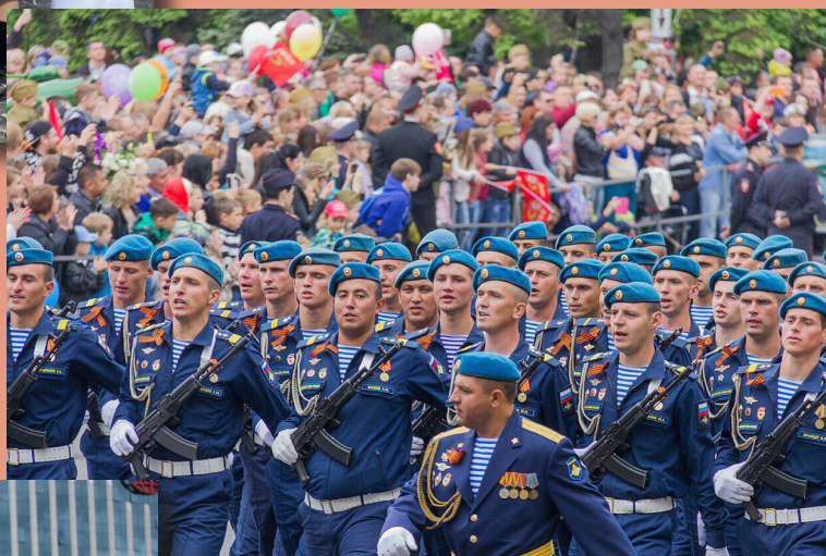
Парад в честь празднования Победы в Великой Отечественной войне 1941–1945 гг. 9 мая 2017 г., Новороссийск