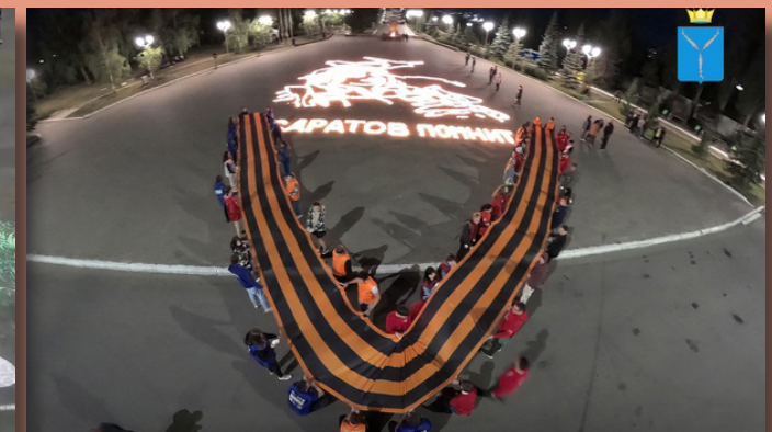
Патриотическая акция «Свеча Памяти» в Парке Победы на Соколовой горе. 22 июня 2023 г., Саратов.