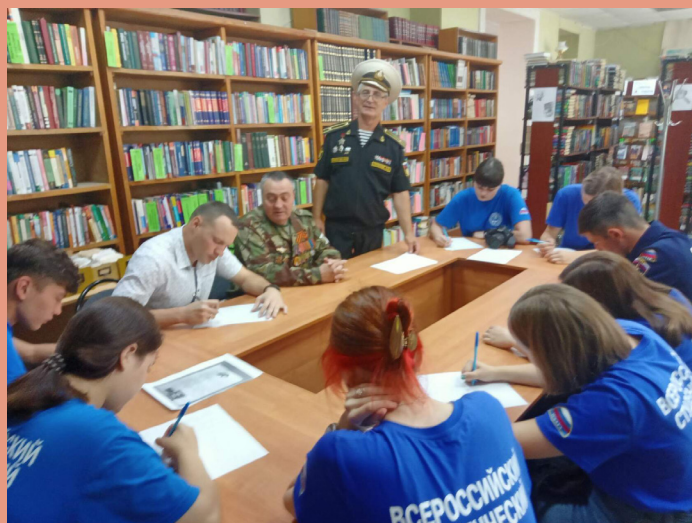
Студенты Саратовского архитектурно-строительного колледжа пишут письма бойцам в зону проведения специальной военной операции.

Центральная городская библиотека для детей и юношества, г. Саратов