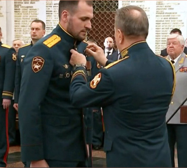
Герой Российской Федерации Никита Палазник на церемонии вручения медали «Золотая Звезда». 27 марта 2023 г. Зал славы Музея Победы, Москва.