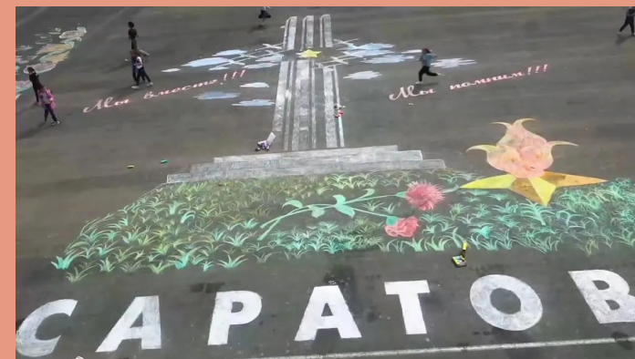
Школьники подарили ветеранам и жителям области самую большую открытку на Театральной площади в Саратове. Композиция размером 25×25 метров (625 м²). Дети мелками изобразили на асфальте монумент «Журавли». 6 мая 2023 г., Саратов