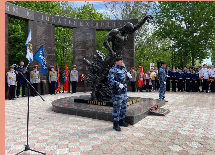
В Парке Победы на Соколовой горе состоялась церемония занесения имён военнослужащих, погибших в ходе проведения специальной военной операции на территории Украины. В преддверии Дня Победы имена бойцов увековечены на мемориале «Землякам, погибшим в локальных войнах». 6 мая 2023 г., Саратов.