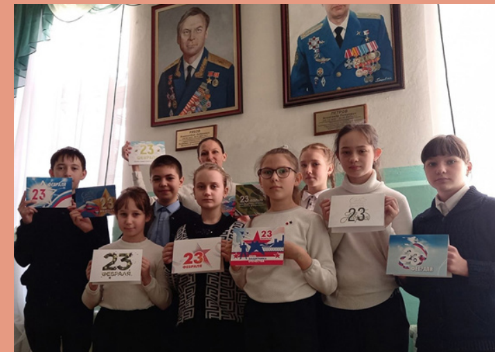
В рамках патриотической благотворительной акции «С теплом из дома» в СОШ № 16 имени Героя Советского Союза К.А. Рябова г. Вольска Саратовской области учащиеся подписали бойцам открытки к 23 февраля, приготовили подарки и сделали окопные свечи