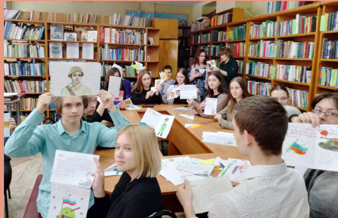
Ученики МОУ СОШ № 6 г. Саратова приняли участие в акции «Письмо солдату». Центральная городская библиотека для детей и юношества, г. Саратов