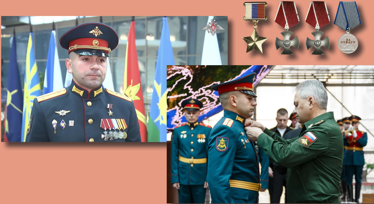
Герой Российской Федерации Тимур Дудкин на церемонии вручения медали «Золотая Звезда» Министром обороны России генералом армии С. Шойгу. 31 мая 2023 г. Национальный центр управления обороной Российской Федерации, Москва.

За мужество и героизм, проявленные при исполнении воинского долга, Указом Президента Российской Федерации от 17 апреля 2023 года Тимур Дудкину присвоено звание Героя Российской Федерации. Медаль «Золотая Звезда» была вручена 31 мая 2023 года. Тимур Юрьевич Дудкин также награжден двумя орденами Мужества и медалью «За отвагу».